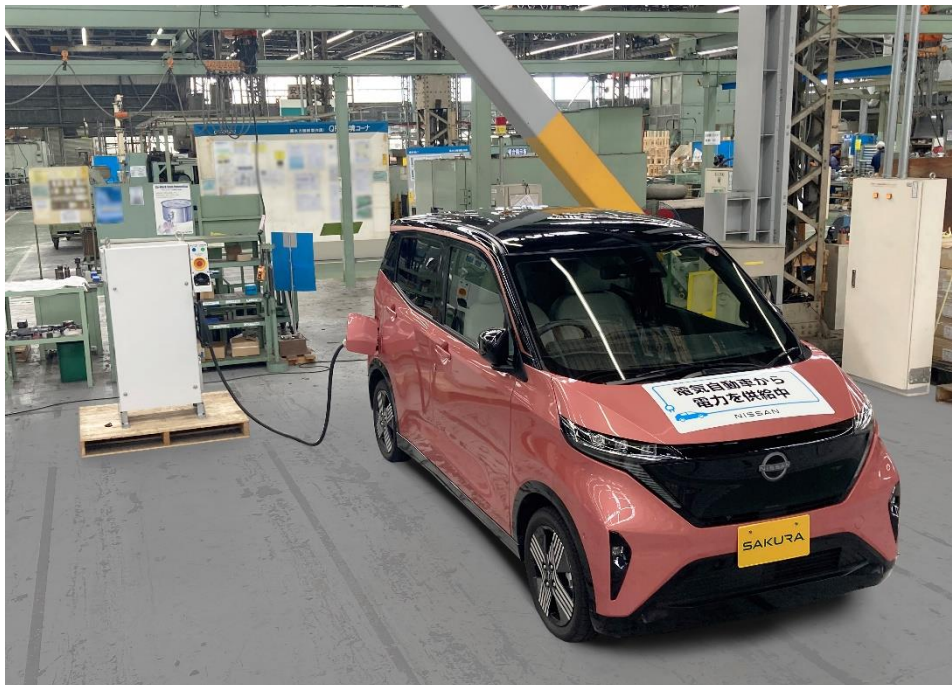
軽電気自動車「日産サクラ」からの給電の様子

本実証実験は、電気自動車からの給電で停電時のビル設備利用を可能にするV2X 1 システムの普及に向けた日産と日立ビルシステムの協創 2 第3弾の取り組みで、軽の電気自動車「日産サクラ」のバッテリーをフル充電状態から、外部給電が可能なバッテリー残量10%まで利用し、日立産機システム製の自動給水ユニット「ダイレクト・ウォーターズ」を稼働させ、21,171リットルの給水を実証 3 しました。これは、8,468人分の1日の水分摂取量 4 、またはトイレ4,234回分の水量 5 に相当します。